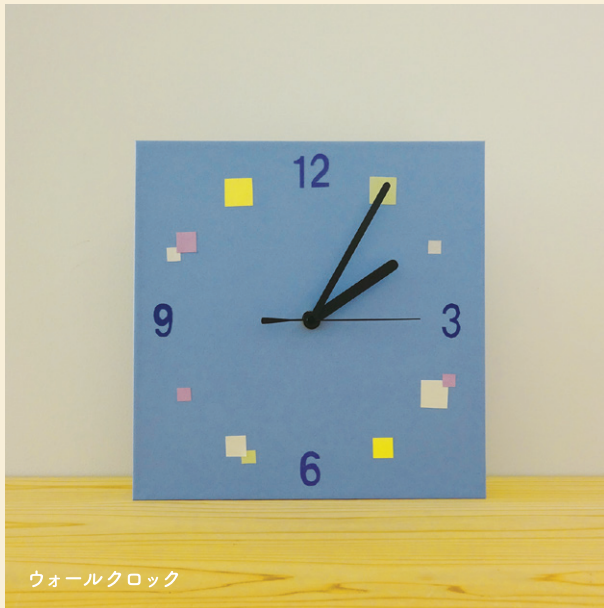
ウォールクロック